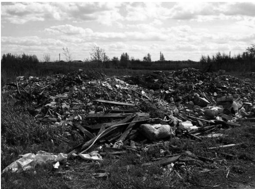
Фото: Свалка в окрестностях дер. Заболотье, Клишева и п. Новое

В Межрайонная природоохранная прокуратура Московской области Адрес: 107996, Москва, Кисельный переулок, д.5 Тел.: (495) 923-98-47, тел/факс. (495) 923 98 47