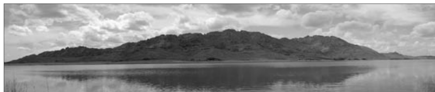
Озеро Караколь. В Казахстане довольно часто называют так озера. Караколь - дословно "чёрное озеро".