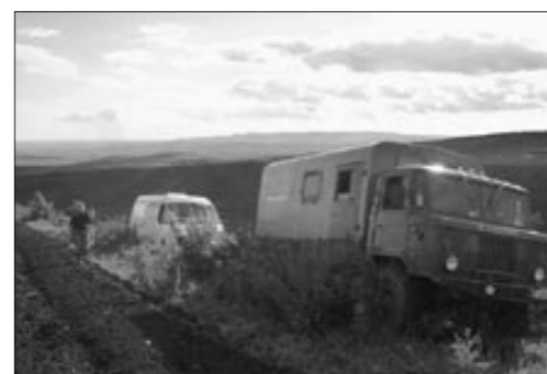
В экспедиции принимали участие ученые из Казахстана, России и Великобритании. На фото: Россия тянет Казахстан, "Газель" ползёт на брюхе. Дороги нет совсем, под колёсами – свежая пашня.