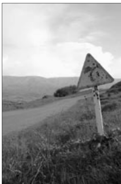
Впереди – крутой поворот

Самое сильное впечатление, конечно же, произвели горы, которые жители равнин видят нечасто. Для меня горы – это совершенно особенная страна. Страна, где погода может меняться 10 раз на дню, где ночью правит холод, а днём пустынь-