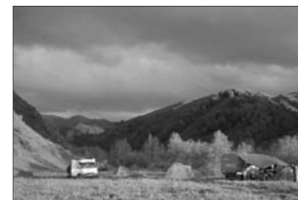
«Мои палаточные города...»